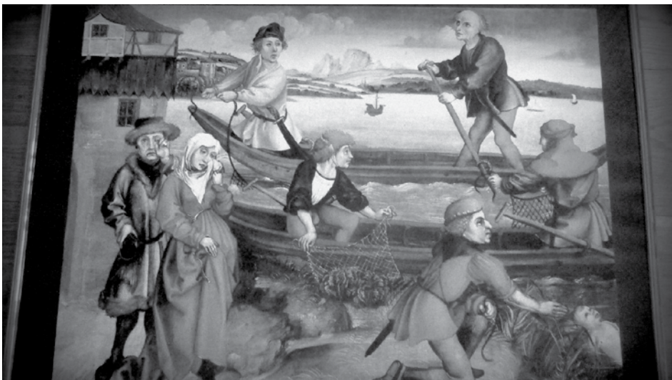
Dürer, Albrecht: Wunderbare Errettung eines ertrunkenen Knaben

Irmtraud Garnitschnig irmtraud.guide@gmail.com